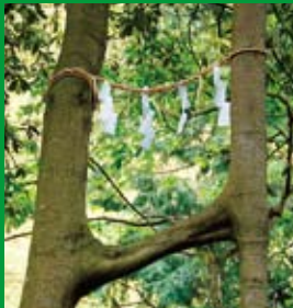
えびす滝横 縁結びの櫻 (連理)