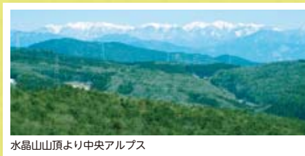
水晶山山頂より中央アルプス