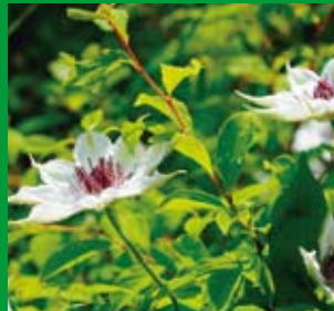
カザグルマ [5月下旬]