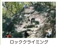
ロッククライミング