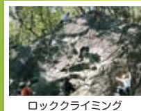
ロッククライミング