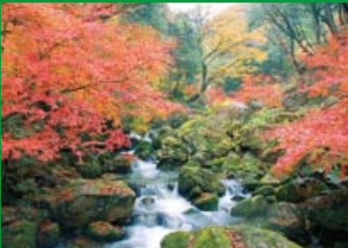
竜吟峡の紅葉 [11月下旬]