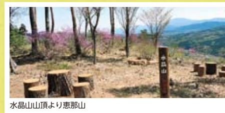
水晶山山頂より恵那山