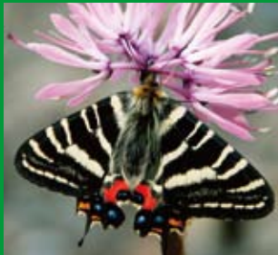
ギフチョウ [4月初旬]